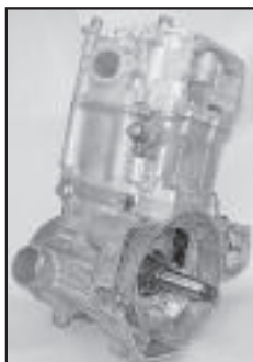
VTT / ATV 500 Polaris