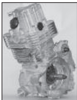
VTT / ATV 325 Polaris (1999 +)