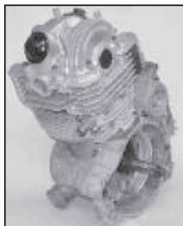
VTT / ATV 325 Polaris (1998 -)