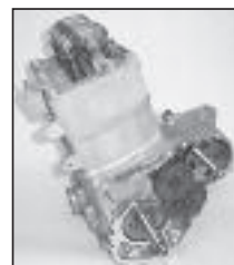
VTT / ATV 600 - 700 - 800cc Polaris